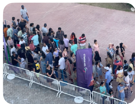
서점 방문을 위해 줄을 선 라스 알 카이마 사람들

저희는 4월 10일 아랍 에미레이트 라스 알카이마 UAE, Ras al-Khaimah 항구에 도착하여 새로운 곳에서의 시간을 다시 맞이했습니다. 아랍 에미레이트는 잘 알려진 두바이 Dubai 라는 도시가 있는 중동의 나라입니다. 석유가 나는 부유한 나라로 외국인이 90%, 본토 현지인이 10% 살고있는 아랍 나라 중 경제적으로 많이 성장한 나라입니다. 그래서 일반적인 아랍 나라들과는 달리 외국인 교회들이 많았고, 사역을 하기에 좀 더 자유로웠습니다. 서점에는 학교와 교회에서 많이 방문하였고, 청소년예배, 연합기도회, 선교 집회 등 다양한 교회 사역을 할 수 있었습니다. 저희는 라스 알 카이마라는 도시에서 서점을 4월 12일 개장하여 일주일 간 서점 문을 열고, 두 번째로 두바이로 가 또 일주일 간 서점 문을 열었습니다.