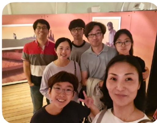
라스 알 카이마에서 만난 도 선교사 모교회 우 집사님 가정