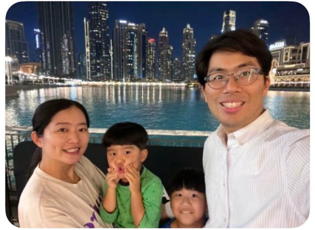
가족사진: 두바이 물에서 야경을 뒤로하고

아무 것도 염려하지 말고 오직 모든 일에 기도와 간구로, 너희 구할 것을 감사함으로 하나님께 아뢰라 그리하면 모든 지각에 뛰어난 하나님의 평강이 그리스도 예수 안에서 너희 마음과 생각을 지키시리라 (빌립보서 4:6-7)