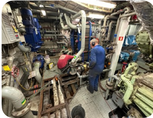
기관 정기 점검을 진행 중인 기관부서 선교사들