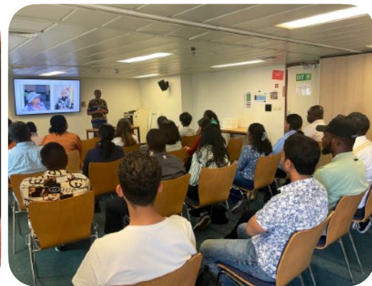
두바이의 다양한 외국인 교회에서 선교선 항구 자원봉사자 참여한 분들을 위한 훈련 중에

라스 알 카이마에서의 특별했던 시간은 도 선교사의 모 교회에서 함께 주일학교 사역을 했던 선생님 가족을 만나 교제했던 시간입니다. 거의 7년 만에 만나는 만남이다 보니 너무 반갑고 그동안 지내 온 시간 들을 나누며 즐겁게 교제할 수 있었습니다. 이런 만남 하나하나가 저희에게는 너무 힘이 되고 기쁨이 되어 한 걸음 더 나아갈 원동력이 됩니다. 또한 한인교회 분들의 방문으로 배 투어도 해 드릴 수 있어서 함께 교제할 수 있어서 감사했고, 방문하셨던 분 중 장로님께서 한인 온라인 마트를 운영 중에 계시는데 저희 한인 선교사들에게 많은 음식을 베풀어 주셔서 정말 감사한 시간이었습니다.